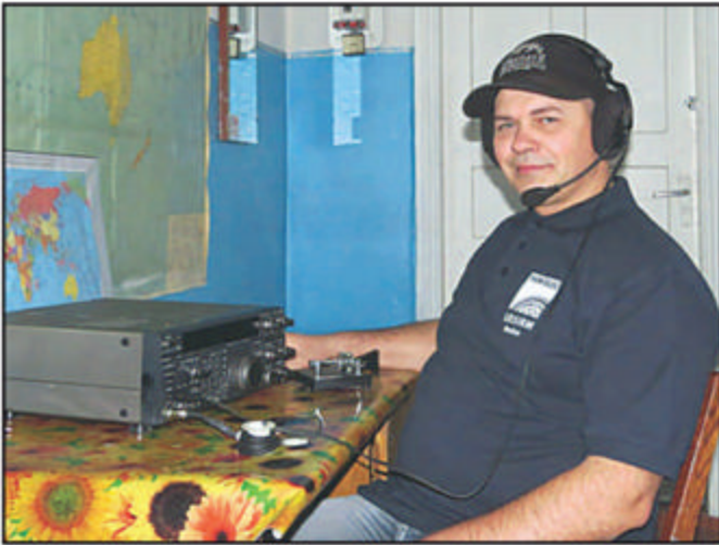
UR5IRM ganador del 2014 Formula Class .